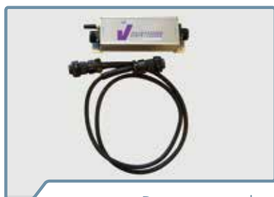
De transceiver box incl. adapterkabel

Bij het V-DAIRY Feeder voermanagementsysteem betekent dit dat u de adapterkabel aansluit en dan meteen aan de slag kunt.