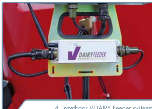
4. Inzetbaar V-DAIRY Feeder systeem