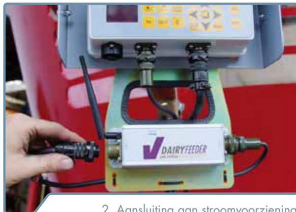
2. Aansluiting aan stroomvoorziening