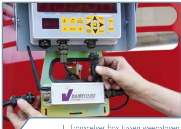
1. Transceiver box tussen weegstaven en weegcomputer aansluiten

De montage van het systeem is eenvoudig. U hoeft enkel de Transceiver Box met de meegeleverde kabel aan te sluiten.