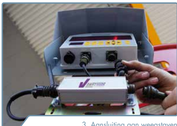
3. Aansluiting aan weegstaven