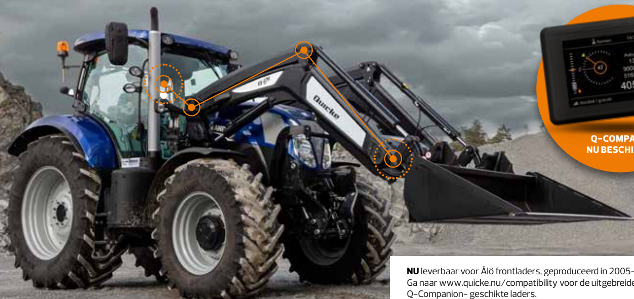
Q-COMPANION® NU BESCHIKBAAR

NU leverbaar voor Älö frontladers, geproduceerd in 2005–2017. Ga naar www.quicke.nu/compatibility voor de uitgebreide lijst van alle – voor Q-Companion- geschikte laders.